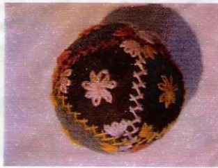
Bolas bordadas (feitas e bordadas pelas cachopas - Escusa - Marvão - Alto Alentejo) "Coleção Museu Escolar Marrazes-Leiria"