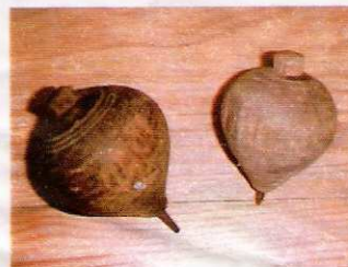
Piões "Coleção Museu Escolar Marrazes-Leiria"