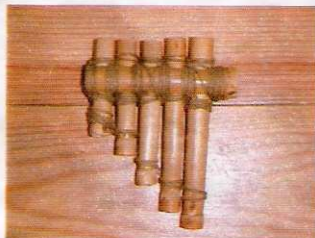
Flauta de cauda usada para brincar ou para o amola tesouras anunciar a sua chegada. "Coleção Museu Escolar Marrazes-Leiria"